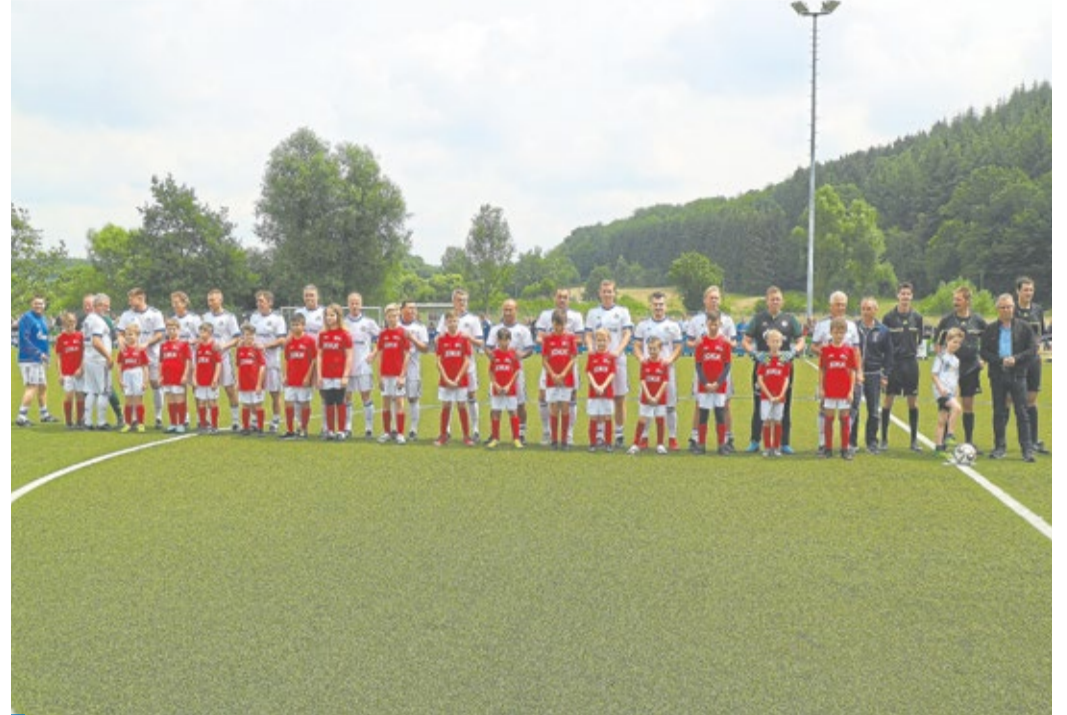
Die Traditionsmannschaft des Schalke 04 – angeführt von Olaf Thon, Klaus Fischer und vielen weiteren prominenten, ehemaligen Spielern – trat gegen eine Westerwald-Auswahl an.

Am Sonntag, den 24.06. rollte das runde Leder ab 13.00 Uhr auf der Emma in Neitersen als die Traditionsmannschaft des Schalke 04 gegen eine Westerwald-Auswahl vor rund 800 Zuschauern gegeneinander antraten. Das Benefizspiel war dabei Höhepunkt der Fußballschule, die die Lebenshilfe Altenkirchen organisiert hatte.