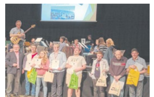
Die SportlerInnen der Lebenshilfe Altenkirchen freuen sich über die besondere Ehrung.