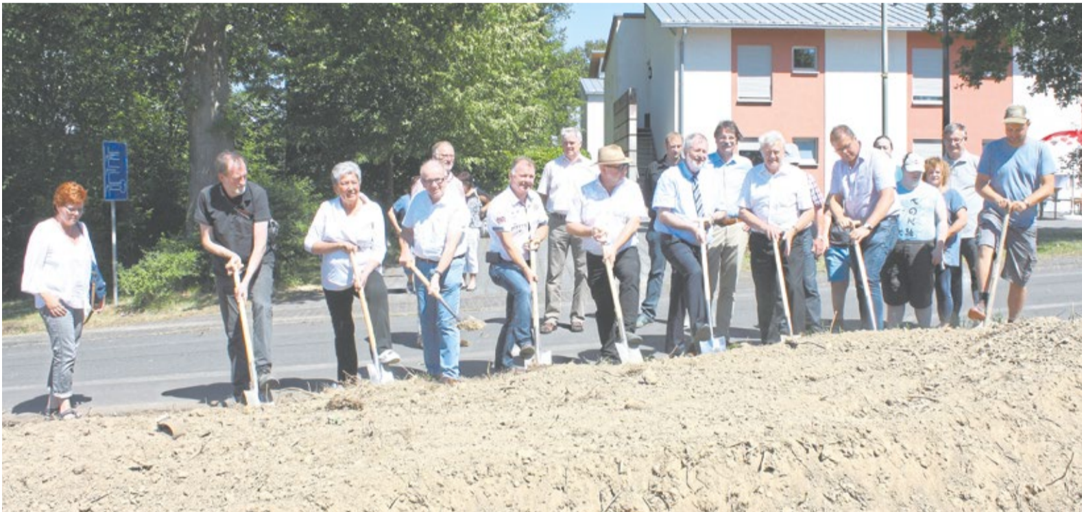
Mit dem symbolischen Spatenstich wurde in Flammersfeld der Baubeginn des Pflegedorfs offiziell gestartet.

Neues Zuhause für 72 Menschen mit und ohne Behinderung